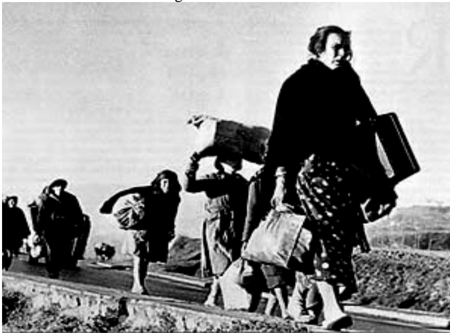
Fotografía de Robert Capa de un grupo de españoles camino del exilio a Francia.

FUENTE HISTÓRICA: Relacione esta fotografía con el exilio durante la dictadura franquista.